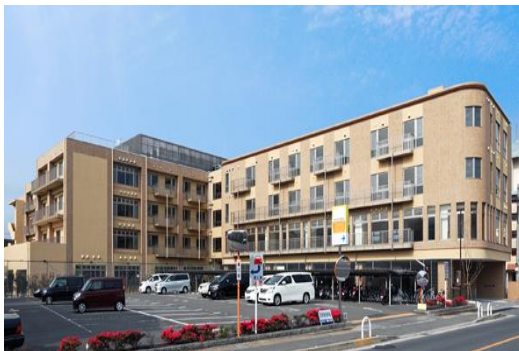
介護老人保健施設 春風