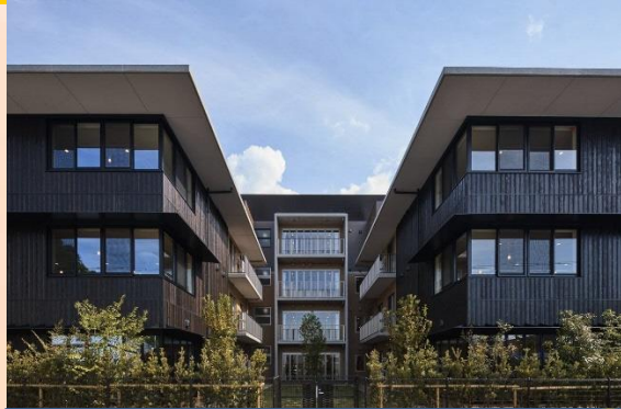
社会福祉法人大樹会