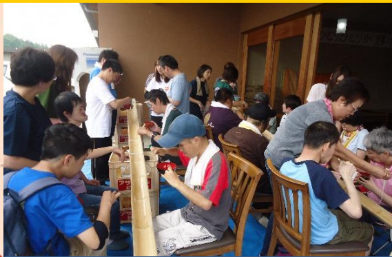
社会福祉法人ふくちやま福祉会