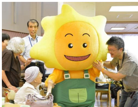
会社のイメージキャラクター 「ぼっぼです。よろしく!」